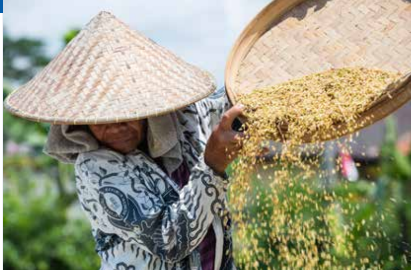
Risicoltore a Ubud, Bali (Indonesia)

In pratica, il 78% dei posti di lavoro in cui è occupata la forza lavoro mondiale dipende dall'acqua.